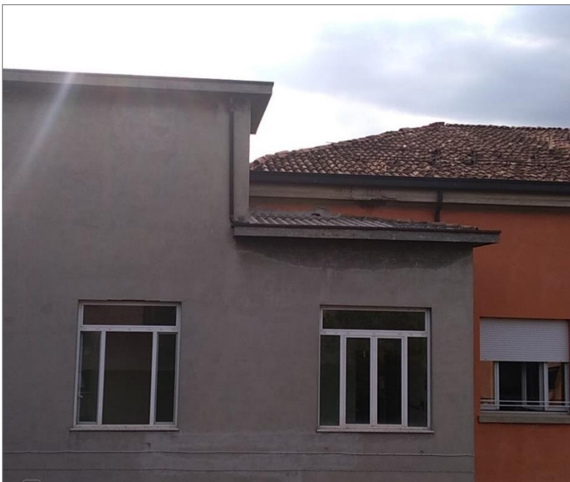
Porzione di copertura in corrispondenza del vano scala settore "Verde"