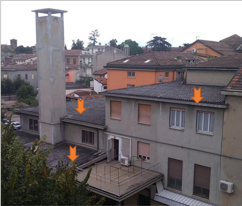
Copertura magazzini e Cappella