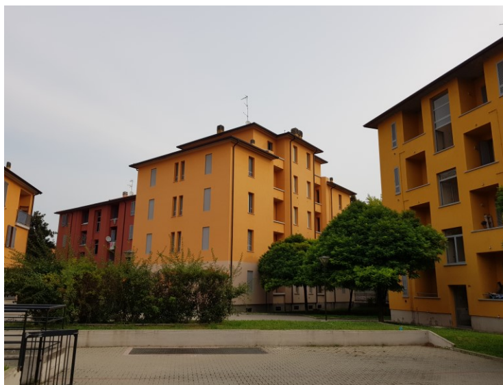
Area interna Q.re B. Roma