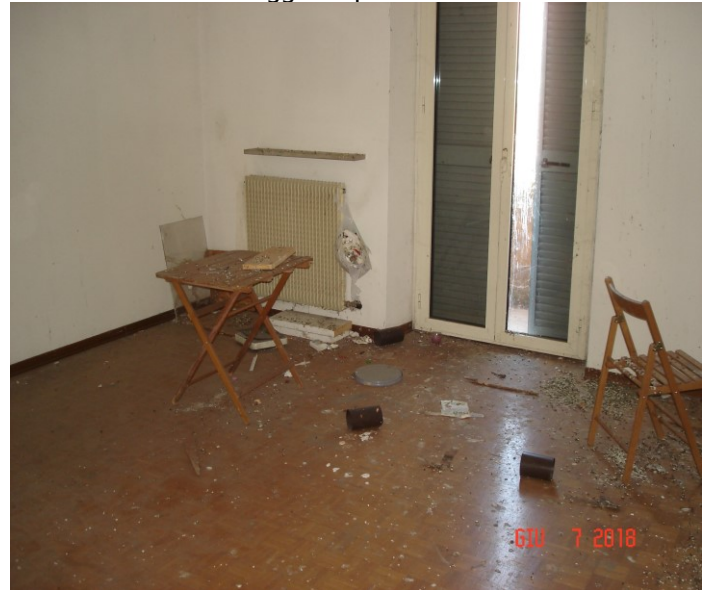
Alloggio duplex int. 15