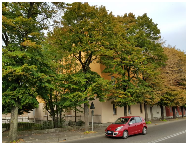
Vista prospetto verso via Primogenita