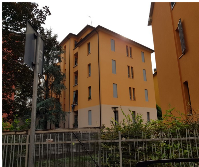
Vista prospetto lato ingresso pal. n. 2