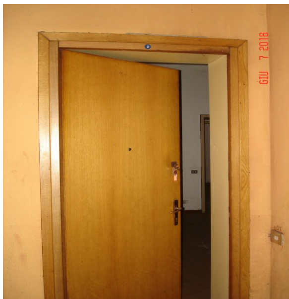
Ingresso di un alloggio tipo